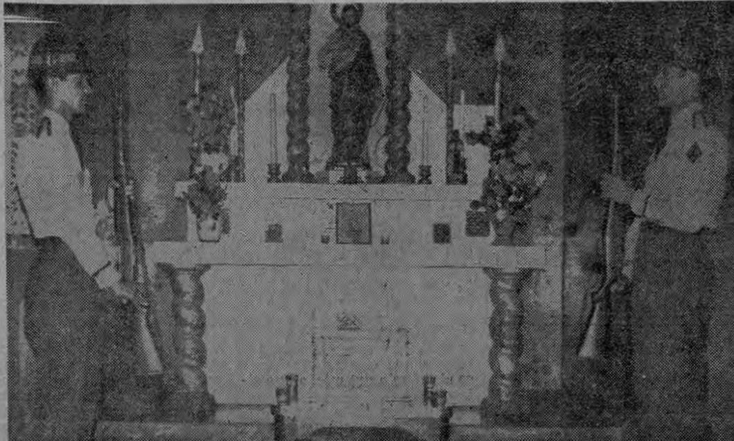
Guardias uniformados cuidan en la Capilla de la Tercera Compañía de la Guardia Civil la caja funeral donde están algunos de los restos de los soldados costarricenses que cayeron en Río Coto en 1921 cuando la guerra con la República de Panamá.

Esos restos quedarán en capilla ardiente toda la noche y mañana se celebrará un entierro simbólico que saldrá de la funeraria Polini hasta el Parque Morazán, —sobre la Avenida