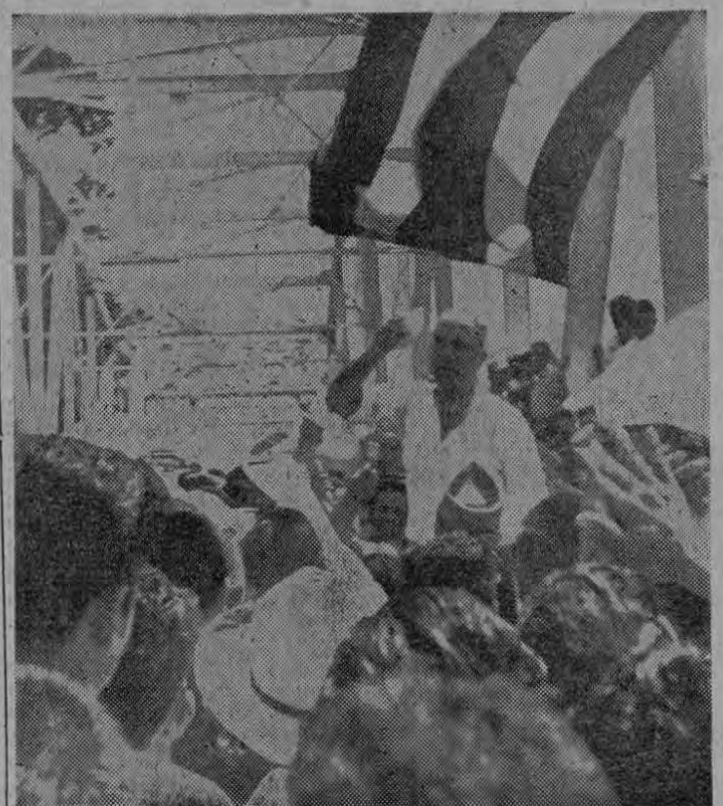
El Presidente Echandi al pronunciar su discurso inaugural en el puente del Río Térraba advirtiendo que si la Bananera no paga los dineros que el Estado dio a los trabajadores la pérdida será considerada buen negocio porque una sola gota de sangre costarricense hubiera valido más que eso.

El Colegio de Ingenieros Agrónomos tomará un acuerdo próximamente a fin de plantearle a los futuros candidatos a la Presidencia de la República la necesidad de que se nombre como Titular de la Cartera de Agricultura y Ganadería a un Ingeniero Agrónomo.