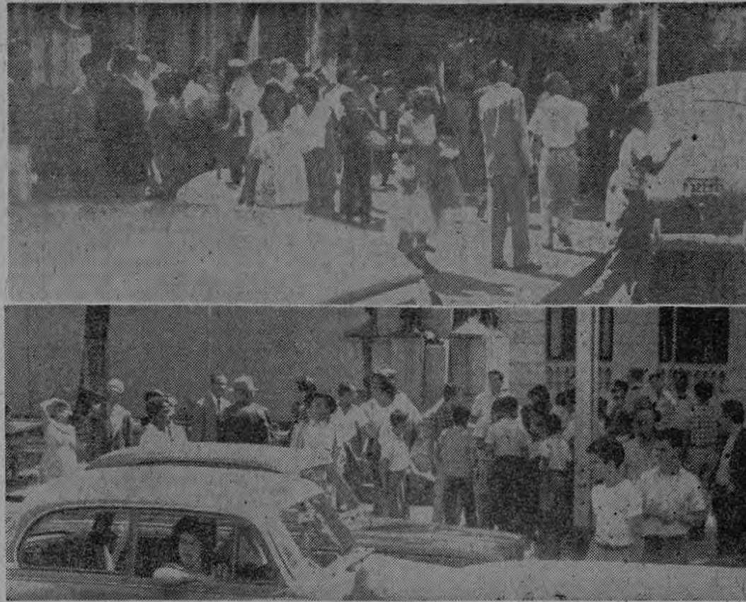
(Arriba). Grupo de ciudadanos alarmados miran hacia las paredes del edificio de Correos y Telégrafos que se agrietó mínimamente en algunos sectores y de cuya techumbre se desprendieron algunas láminas de zinc