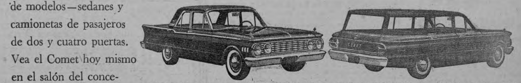
Sedán Comet de 4 puertas—con amplio espacio para seis pasajeros y maletero con un mundo de espacio para el equipaje. Camioneta de pasajeros Comet—espacio de carga de camioneta grande, ventanilla posterior retráctil para facilitar cargarla.

¡El único auto compacto con el refinado estilo de un auto de lujo! Líneas alargadas y airoas, discreto uso del cromado. El Comet es el primer compacto que ofrece un interior verdaderamente amplio a sus pasajeros. Con una distancia entre ejes de 3,66 mts., el Comet le proporciona la espaciosa comodidad que no existe en otros compactos. Amplitud y funcionamiento de auto grande, facilidad de manejo de uno compacto. Selección de dos motores de 6 cilindros, de funcionamiento económico... y variedad de modelos—sedanes y camionetas de pasajeros de dos y cuatro puertas.