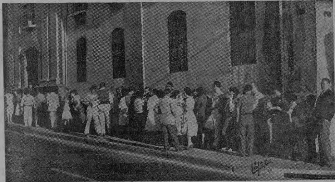
EN LA ESCUELA JUAN RUDIN. — Panorámica de la enorme cantidad de padres de familia que se dio cita frente a la Escuela "Juan Rudin" para matricular a sus hijos que cursarán este año el Primer Grado. La matrícula se efectuó en todas las Escuelas del país y oficialmente se nos informó que no faltó campo para ningún pequeño.

El Poder Ejecutivo se dirigirá oportunamente a la Asamblea Legislativa solicitándole tramitar el mencionado proyecto de ley que contiene disposiciones sobre la explotación de la bauxita y otros minerales.